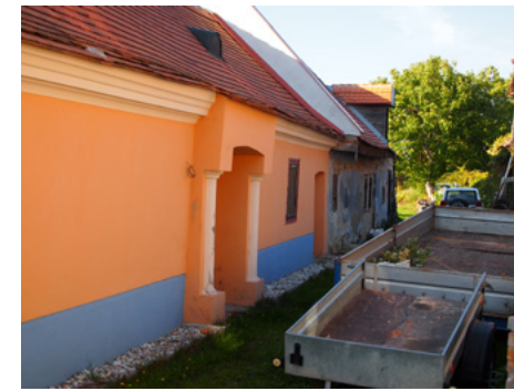
Obrázok 9 Výpustok na dome v Záhorskej Bystrici

ktorá patrí k starším stavebným technikám, je doložená už u neolitických stavieb. Súvisí s krokrovou konštrukciou strechy, jej funkciou bolo staticky podopierať ťažkú strechu so slamenu krytinou, a takto odbremeniť hlinené alebo drevené steny. Obmedzuje sa na strednú časť Záhoria, pokrytú borovicovými lesmi s piesčitou, vlhkou pôdou a najmenej kvalitnou hlinou.