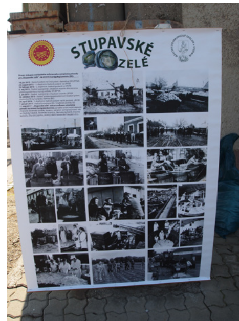
Obrázok 5 Na slávnostiach Dni zelá v Stupave - pripomenutie pestovania stupavskej kapusty, ktorá získala v roku 2017 európske ochranné označenie pôvodu

– odev, nábytok a pod 2 . Pomerný dostatok lúk a pasienkov priaznivo ovplyvnil rozvoj chovu dobytky a oviec. V dôsledku ekonomických aktivít na majetkoch viedenského dvora sa v druhej polovici 18. a v prvej polovici 19. storočia zaviedol na cisárskych panstvách Holíč a Šaštín chov oviec merino.