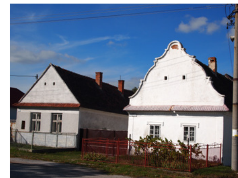
Obrázok 12 Rezervácia ľudovej architektúry v Plaveckom Petri

V 20. storočí charakterizuje obydlie najchudobnejších Záhorákov. Najrozšírenejším typom je štít v tvare rovnoramenného trojuholníka. Je typický pre štítovo orientované domy. Jednotlivé miestne typy sa odlišujú iba uhlom, resp. sklonom strechy a pomerom veľkosti štítu a ostatnej časti priečelia. Špeciálnym variantom je vysunutý štít, ktorý prečnieva niekoľko cm cez rovinu strechy. Všetky štíty, či už na obytných domoch alebo na stodolách majú dvojicu vetracích otvorov, „okének“, ktoré sú rôzneho tvaru. Tieto otvory boli dlhodobo jediným dekoratívnym prvkom v štítoch, aj keď primárne sú funkčným architektonickým článkom. Štít je od ostatnej časti priečelia domu oddelený strieškou,