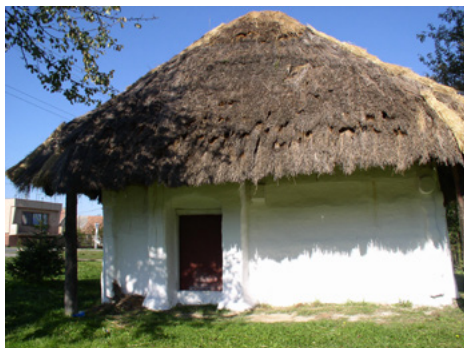
Obrázok 11 Borský Mikuláš, časť Borský Peter

zásuvkové komody („šuplátové, šuflátové kasle“). Väčšinou aspoň jedna posteľ v izbe bola „vistuaná“. Na „duchnu“ na posteli sa po výške poukladali „polštáre“. V bohatších rodinách až po strop. Okrem toho v izbe viseli jedno – dve „bidéuka“. Na jednom boli dva – tri „polštáre“. V domácnostiach s malými deťmi interiér dopĺňala „kolébka“ a „postelka“ („kolečková posteľ“). „Kolébka“ stála pri posteli