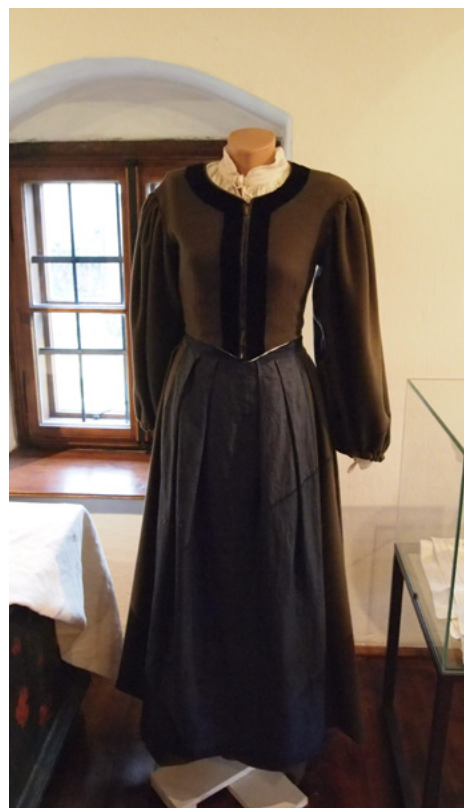
Obrázok 4 Podľa dokladov habáni nosili remeselnícky mestský odev s veľkými klobúkmi, časom však v obliekaní podľahli vplyvu miestneho obyvateľstva