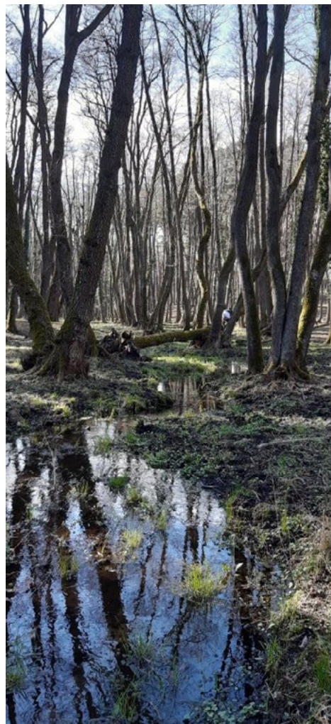
Obrázok 3 Lužné lesy, tzv. tvrdé luhy v okolí vodných tokov, v extraviláne Lozorna, foto: V. Kotradyová

tvoria krajinné subtypy: subtyp poriečnych nív s oráčinami, lúkami, fragmentmi lesov a vidieckou sídelnou štruktúrou, subtyp riečnych terás, ktoré predstavujú z hospodárskeho hľadiska jadro nížiny, lebo sa na nich sústreďuje osídlenie, poľnohospodárska výroba a priemysel, subtyp depresii na úpäti Malých Karpát, na ktorých okraj sa koncentrujú vidiecke sídla, ale pre nepriaznivé hydrografické pomery je poľnohospodárska výroba obmedzená, subtyp sprašovej pahorkatiny s intenzívnou poľnohospodárskou výrobou a vidieckou sídelnou štruktúrou a subtyp neogénnej pahorkatiny s intenzívnou poľnohospodárskou výrobou a hospodárskymi lesmi.