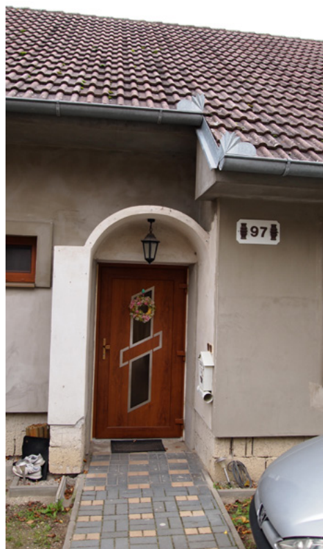
Obrázok 10 Imitácia výpustku v súčasnej úprave, Veľké Leváre

jednotlivé subregióny Záhoria charakteristické odlišné dispozičné riešenia, v recentnom období mali nerovnaké zastúpenie v rôznych oblastiach tohto územia a boli závislé na množstve rôznorodých urbanistických a hospodárskych podmienok. Dominancia jedného z oboch typov v konkrétnej lokalite/subregióne súvisel jednak s geomorfologickým členením krajiny, a jednak s ekonomickou situáciou a otvorenosťou voči inovačným vplyvom.