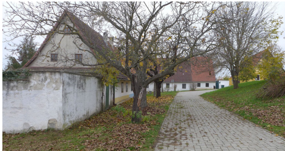
Obrázok 18 Habánsky dvor vo Veľkých Levároch

V regióne sa zachovalo aj viacero pamiatok na mlynárske remeslo. Unikátom je jediný zachovaný veterný mlyn na Slovensku, tzv. pojvetrňák v Holíči. Je bez vnútorného vybavenia. Potočné vodné mlyny boli v habánskych sídlach, dosiaľ sa zachovali názvy Habánsky mlyn, na miestach výskytu mlynov, resp. ich torza. Mlyny však boli rôzneho typu a tiež majú v súčasnosti rôzne využitie v súčasnosti. Niektoré boli reštituované a slúžia ako obydlie alebo víkendové chalupy – napr. Theberyho mlyn v Dojči, mlyny v Osuskom – Kučerových mlyn v Hradišti pod Vrátnom, Kičkársky (habánsky) mlyn v Podbranči, v Škodáčkovom mlyne v Senici je múzejná expozícia Mlyny a mlynárske remeslo.