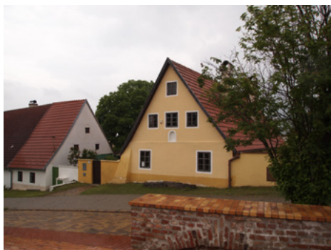
Obrázok 16 Habánske múzeum je umiestnené v Iserovom dome z roku 1717, ktorý je súčasťou pamiatkovej rezervácie ľudovej architektúry

účelnosti. Zložitá povalová konštrukcia habánskych domov, tvorená masívnou mešternicou („rošt“) a systémom podporných stĺpov, nebola habánskym kultúrnym špecifikom.