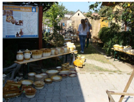
Obrázok 22,23 Keramický dvor počas podujatia Sekulské remeselnícke dvory, september 2014, zdroj: https://obecsekule.sk/obec/sekulske-remeselnicke-dvory/ polovici 20. storočia