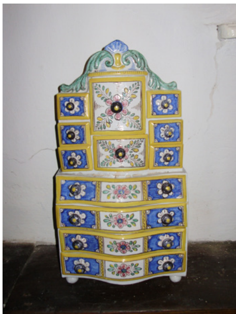
Obrázok 7 Rokoková keramická skrinka v múzeu Ferdiša Kostku v Stupave