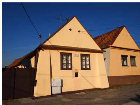
Obrázok 1 Pamiatková zóna v Záhorskej Bystrici, mestskej časti Bratislavy, foto: Z. Beňušková

Výnimočná je jeho hraničná poloha na rozhraní troch štátnych útvarov. Záhorie nielen geograficky, ale aj kultúrne akoby oddeľovalo a zároveň spájalo juhozápadné Slovensko s juhovýchodnou Moravou, s oblasťou kultúrne aj jazykovo blízkeho Moravského Slovácka, a s Dolným Rakúskom, predovšetkým s oblasťou Moravského Poľa (Marchfeld). Posledných desať storočí tvorila rieka Morava prirodzenú hranicu; v dôsledku svojej hraničnej polohy je územie regiónu pretkané sieťou tranzitných ciest, strážnych aj trhových miest a dedín, ktorým dominujú strážne výšinné aj vodné hrady.