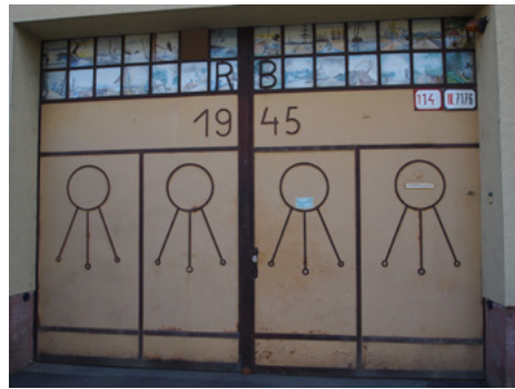
Obrázok 21 Železná brána v Záhorskej Bystrici s maľovanou sklenenou výplňou. Malovanie obrázkov na sklá na bráne a steny podbránia bolo na Záhorí obľúbené v druhej polovici 20. storočia

tak výrazne zastúpené ako v regiónoch na strednom Slovensku ako je Horehronie či Podpoľanie.