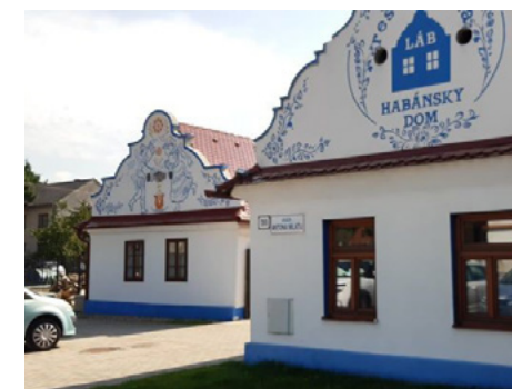
Obrázok 13 Reštaurácia Habánsky dvor v Lábe

obyčajne z dvoch radov škridiel. V súvislosti s emancipáciou roľníckeho stavu a s prehľbovaním sociálnej stratifikácie súvisiacej so zavádzaním kapitalistickej ekonomiky sa podobne ako v iných častiach juhozápadného Slovenska, aj v tomto regióne v poslednej tretine 19. storočia objavujú barokové štíty. Štíty s barakovými slohovými ohlasmi sú ozdobne členené, na vrchole niektorých stojí ozdobná hruška. Vo väčšine vidiecky lokalít sa prestali stavať ešte pred prelomom storočí. Snaha o reprezentáciu sociálnej prestíže sa