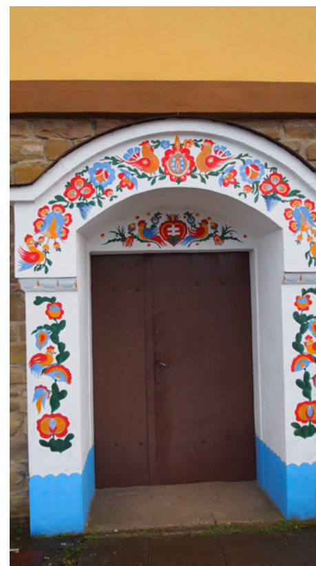
Obrázok 15 Výpustok na vinohradníckej búde

počas uplynulého polstoročia získavajú aj obytné funkcie, sú vinohradnícke búdy v zázemí kultúrnej krajiny mesta Skalica 25 .