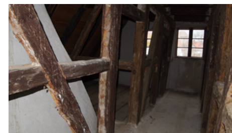
Obrázok 17 Podkrovia habánskeho Iserovho domu vo Veľkých Levároch, foto: Z. Beňušková.

Zo stavebného hľadiska možno väčšinu dispozičných úprav v prízemí nepriamo ohraničiť časovou líniou zavedenia sporákov, t.j. časovo zaradiť pravdepodobne pod polovicu 19. storočia. Zmena dispozície a spôsobu užívania veľkých domov je možné považovať za odraz zásadných spoločenských zmien 17. – 18. storočia, hlavne po rozpade spoločných bratských hospodárstiev a zavedení súkromného vlastníctva. Z riešenia bytov sa dá vyčítať zmena životného štýlu obyvateľov dvora, príklon k vyspelému vzoru remeselnického bývania vychádzajúceho viac z kultúrnych modelov vlastných urbánnemu