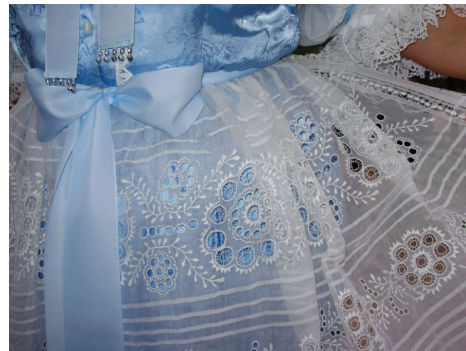
Obrázok 8 Detail zástery sviatočného odevu z Lábu

Barokovú zdobnosť pripomínajú veľké guľovité rukávy na rukávcoch. Tvar držali vďaka zdvojeniu rukávcoch. Spodné boli naškrobené, ukončené manžetou, údajne sa vypchávali aj klobúkovým papierom, aby