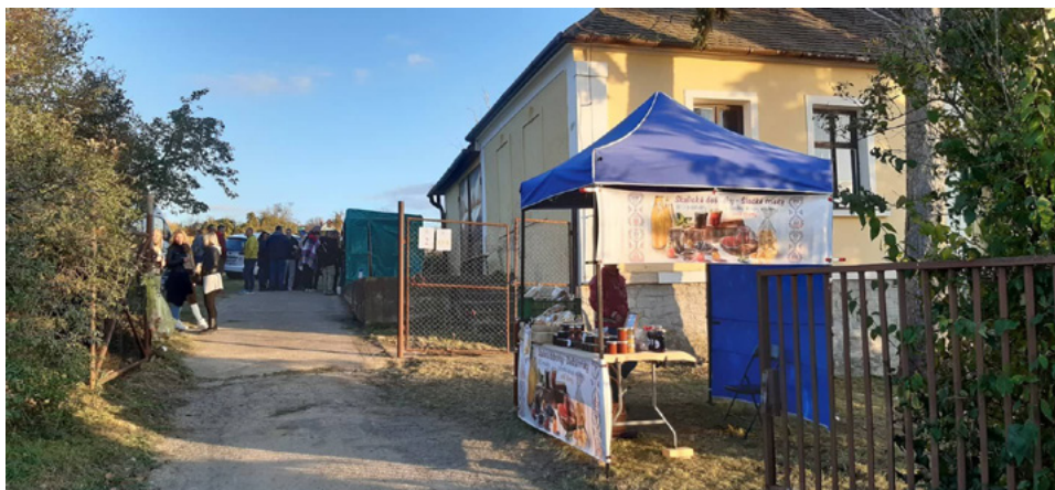
Obrázok 25 Pekáreň Skalické dobrotky na Dňoch otvorených búd v Skalici