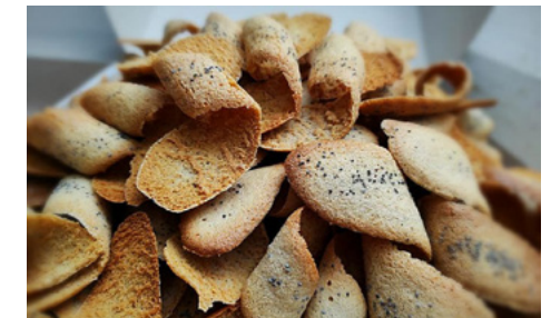
Obrázok 24 sladké trisky Pekárne Skalické dobroty

V tomto regióne badať aj snahu o prezentovanie regionálnych špecifik priamo v reštauračných zariadeniach ako je Habánsky dvor v Lábe, ktorý sídlí v objekte ľudovej architektúry, ktorý ale prešiel výraznou rekonštrukciou. V susednom kopaničiarskom regióne je v gastronomickej oblasti výrazným zjavom reštaurácia s penziónom Holotých víška, kde je možné zažiť modernú gastronómiu založenú na regionálnej tradičnej kuchyni, čo môže byť inšpiráciou aj pre Záhorie, ktoré má príbuzné prvky.