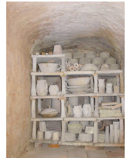
Obrázok 6 habánska pec v múzeu Ferdiša Kostku v Stupave, foto: Z. Beňušková

Jozefa II. kartúnka upadala, až neskôr zanikla. Svoju činnosť v tejto dobe začali aj papierne v Borinke, Stupave a neskôr v Sološnici. V 18. storočí mala významné miesto aj Skalica, ako hlavné stredisko remeselnej výroby v Nitrianskej župe a kultúrne centrum Záhoria. Skalica bola zároveň aj kníhtlačiarstvom centrom. Prvú kníhtlačiareň založili jezuiti v druhej polovici 17. storočia. Skalica a Senica boli významné aj výrobou mydla a sviečky v 17. storočí tu mali výrobcovia až 11 cechov. Vo Veľkých Levároch vplyvom remeselných aktivít Habánov existovalo v 17. storočí 9 cechov. V tom čase v Malackách a Stupave iba po jednom samostatnom debnársky a hrnčiarsky, ostatní remeselníci sa združovali v cechoch, kde bolo viac remesiel.